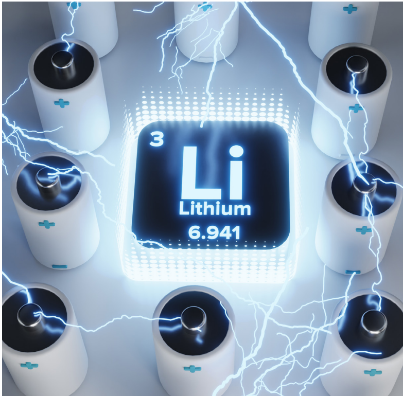
1234_Lithiumschichten für Kathoden von Lithium-Schwefel-Akkus