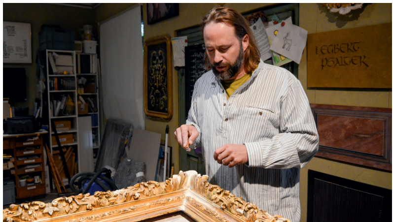
1012_Reportage: Von der Restauration zur VIP-Vergoldung