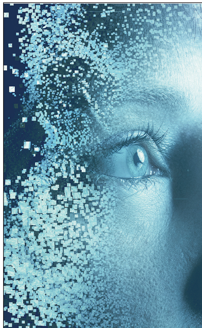
1037_Special: Transformation + KI