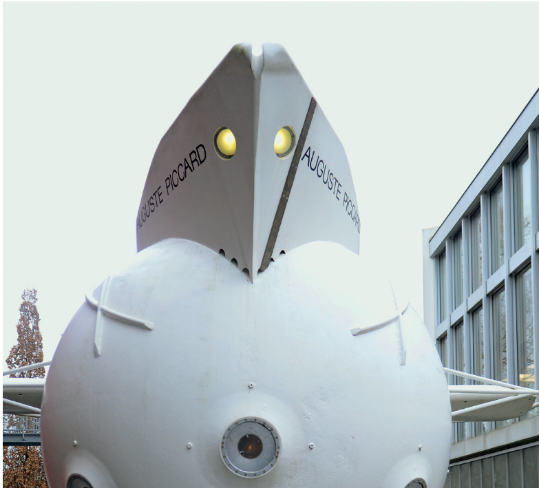
470_ Als im Genfer See noch U-Boote tauchten