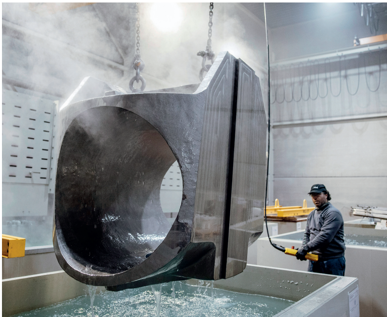
447_ Wie der Ukrainekrieg die Branche trifft