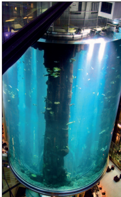
172_ Warum platzte der Aquadom?