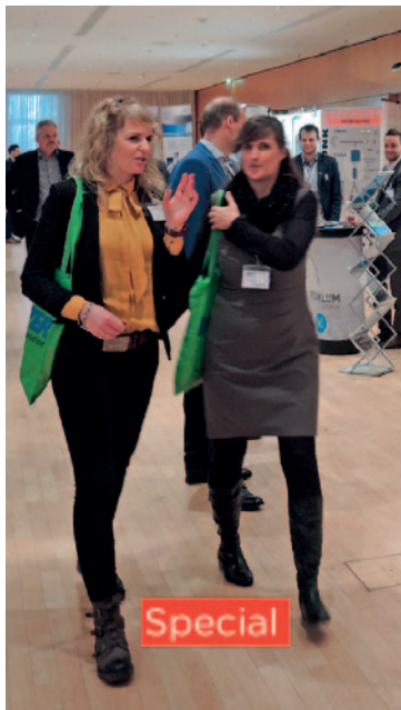
197_ Leipziger Fachseminar